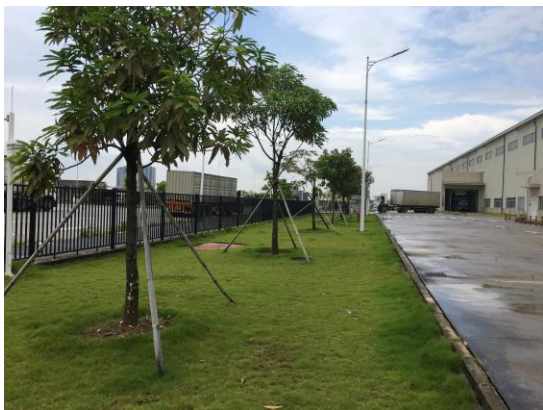
图 5：一期东侧园林绿化现状