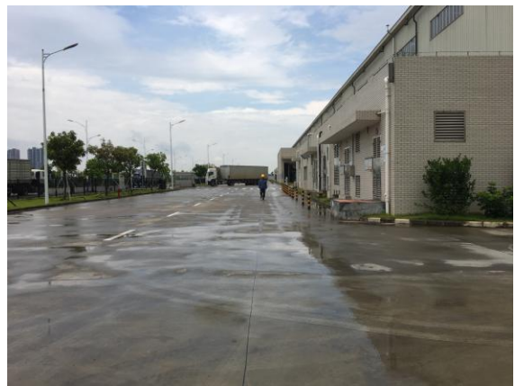
图 4：一期东侧内部道路现状