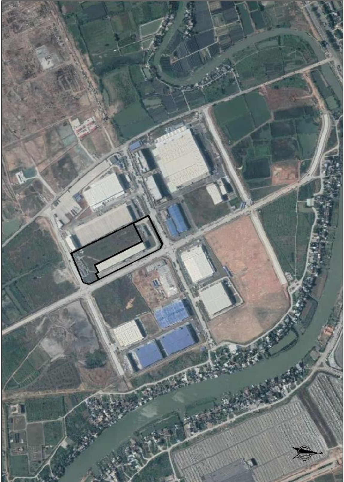
项目建设后遥感影像图