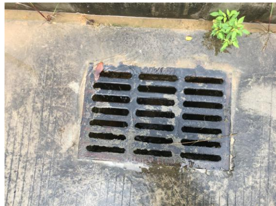
图 6：一期东侧排水管网现状