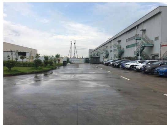
图 10: 一期西侧内部道路现状