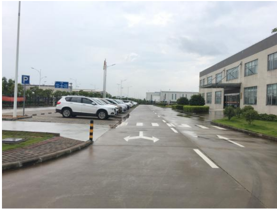
图 1：一期北侧内部道路现状