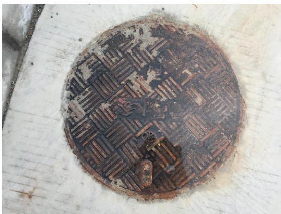
图 3：一期北侧排水管网现状