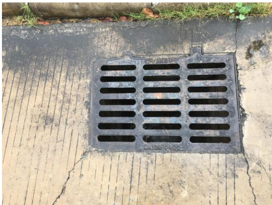
图 9: 一期西侧排水管网现状