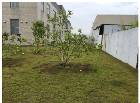
图 8:一期中部园林绿化现状