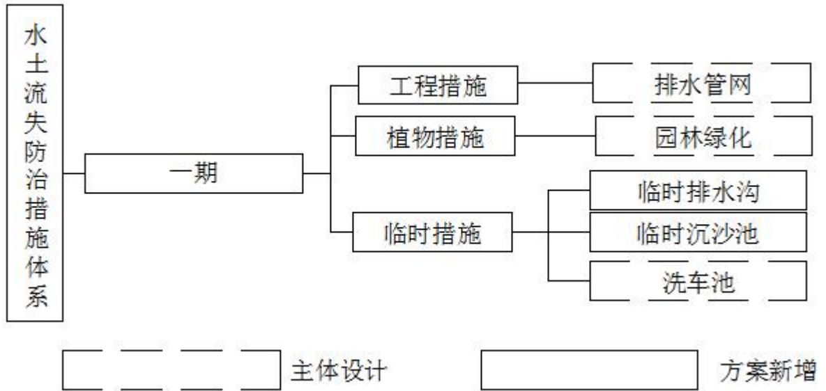
图 3-1 水土流失防治体系框图

项目区在建设期间布设了洗车槽、沉沙池以及排水管网、园林绿化等。区内雨污分流排水体制，雨水最终接驳金荷二路（4 号路）下敷设的市政管网。实际的水土流失防治体系见下图。