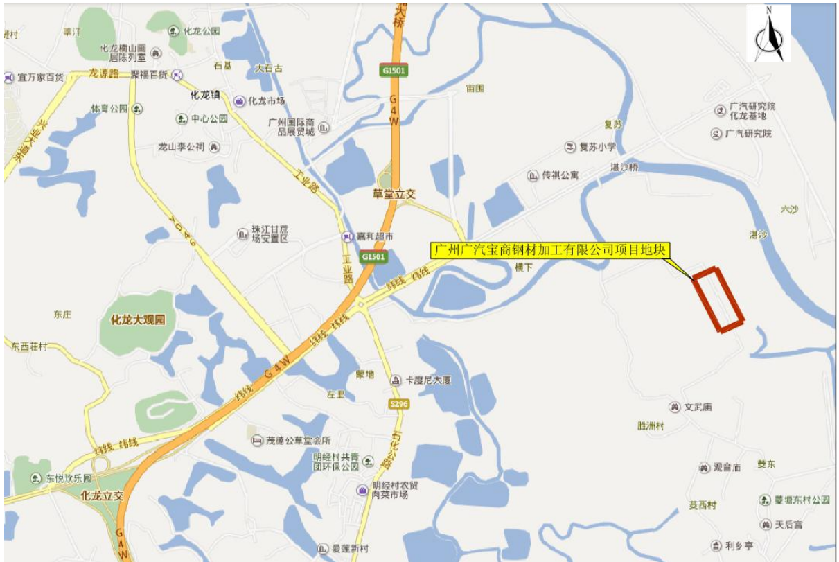
图 1 工程地理位置图

广州广汽宝商钢材加工有限公司项目地块（一期）位于广州市番禺区石楼镇胜洲村现代产业园地块2。详见图 1。