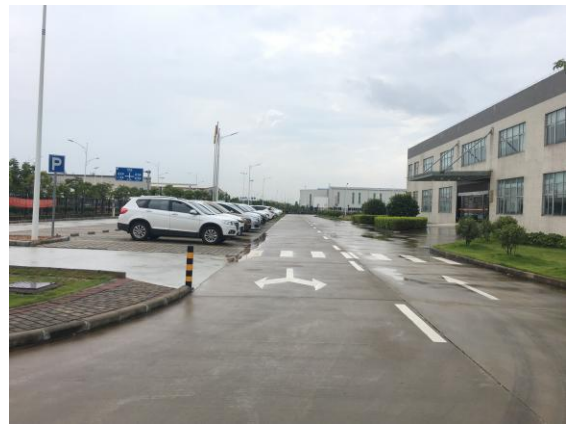
图 2：一期北侧园林绿化现状