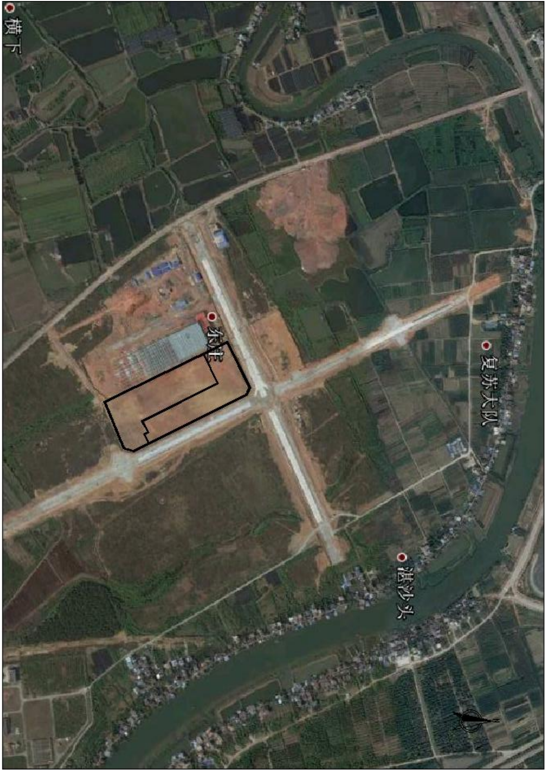
项目建设前遥感影像图