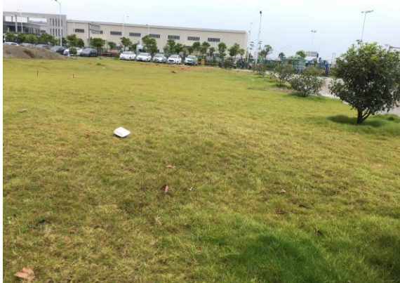
图 7:一期中部园林绿化现状